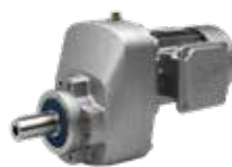
Carcaça com flange B14, motor integrado