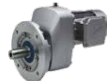
Carcaça com flange B5, motor integrado