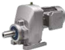
Carcaça com fixação por pés, flange B14, motor integrado